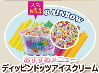
おすすめメニュー ディップドッツアイスクリーム