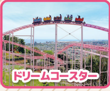
ドリームコースター