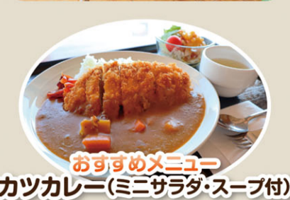
おすすめメニュー カツカレー(ミニサラダ・スープ付)