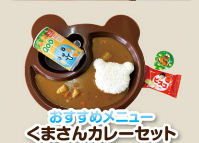
おすすめメニュー くまさんカレーセット