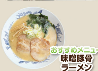
おすすめメニュー 味噌豚骨 ラーメン