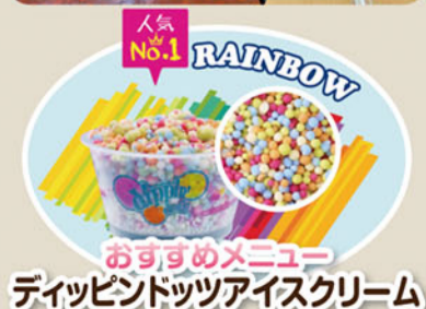
おすすめメニュー ディップドッツアイスクリーム