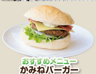
おすすめメニュー かみねバーガー