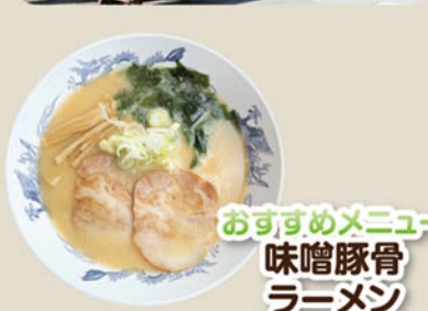
おすすめメニュー 味噌豚骨ラーメン