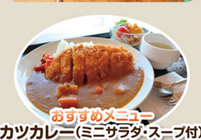
おすすめメニュー カツカレー(ミニサラダ・スープ付)