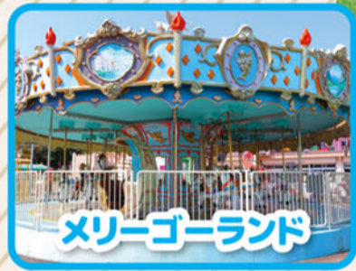
メリーゴーランド