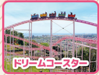
ドリームコースター