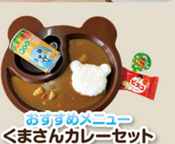
おすすめメニュー くまさんカレーセット